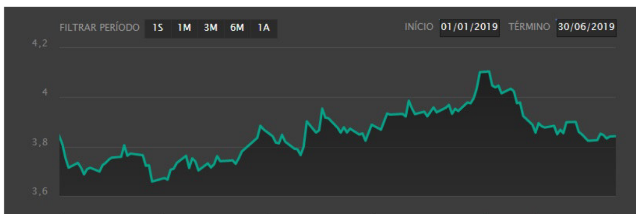
Gráfico 1: Variação do dólar comercial de 01/01/2019 até 30/06/2019.

- Conjuntura Econômica: No primeiro semestre de 2019 o dólar subiu ao longo dos meses, saindo de 3,8096 em 02/01/2019 para 4,1049 em 20/05/2019, a cotação mais alta do período. Isso aconteceu devido a fatores externos (disputa comercial entre Estados Unidos e China) e a desentendimentos internos sobre a reforma da previdência. Com isso, o Banco Central interviu com a venda de contratos de swap cambial, para conter a alta da moeda americana, o que fez com que o dólar recuasse e fechasse o semestre a 3,8410. A previsão para o segundo semestre de 2019 é de alta do dólar.