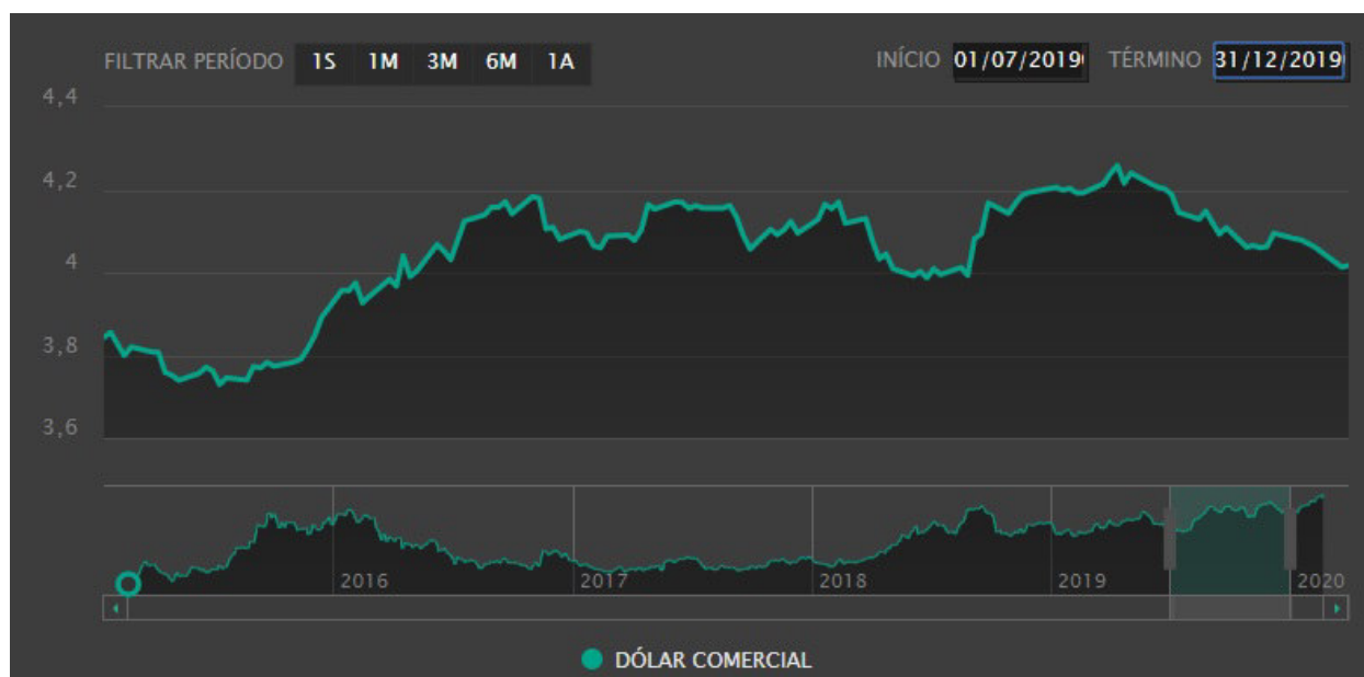
Gráfico 1: Variação do dólar comercial de 01/07/2019 até 31/12/2019.

- Conjuntura Econômica: No segundo semestre de 2019 o dólar manteve o movimento de alta, chegando a bater o recorde histórico de 4,2586 em 27/11/2019. Os motivos se mantêm, ou seja, externamente a guerra comercial entre Estados Unidos e China e internamente a Reforma da Previdência. O Banco Central fez novas intervenções para conter a alta do dólar, com a venda de contratos de swap cambial, mas a moeda americana terminou o ano de 2019 em alta.