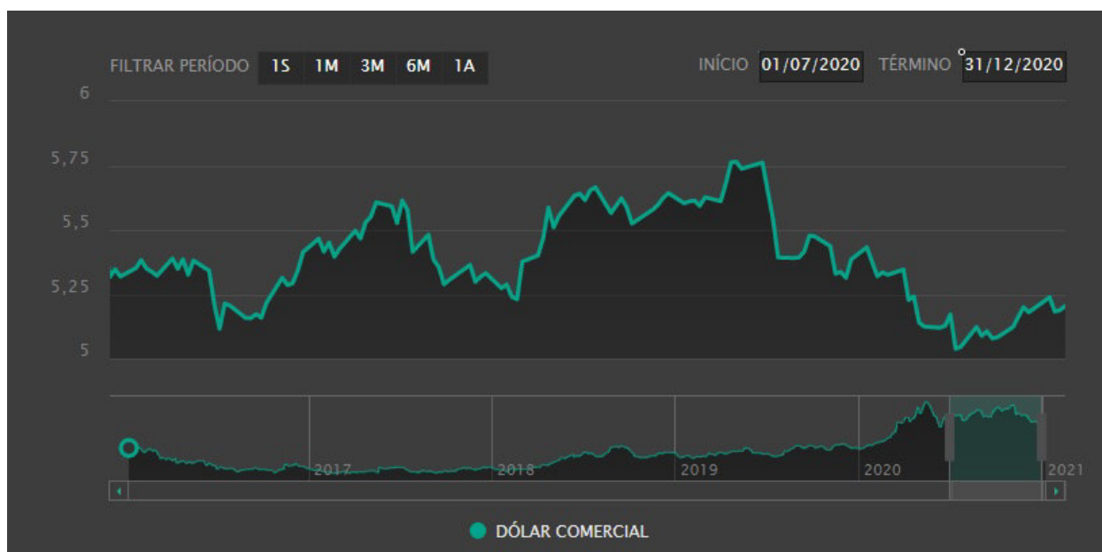
Gráfico 1: Variação do dólar comercial de 01/07/2020 até 31/12/2020.

- Conjuntura Econômica: No segundo semestre de 2020 houve a continuação da pandemia do novo Coronavírus (COVID-19), e conseqüentemente uma continuação da crise sanitária e econômica. O dólar subiu até o começo de novembro, chegando a ser negociado a 5,75, e depois voltou a cair devido à recuperação do mercado acionário, encerrando o ano de 2020 cotado a 5,1887. O aumento do dólar em 2020 causou o aumento do preço dos alimentos e a aceleração da inflação.